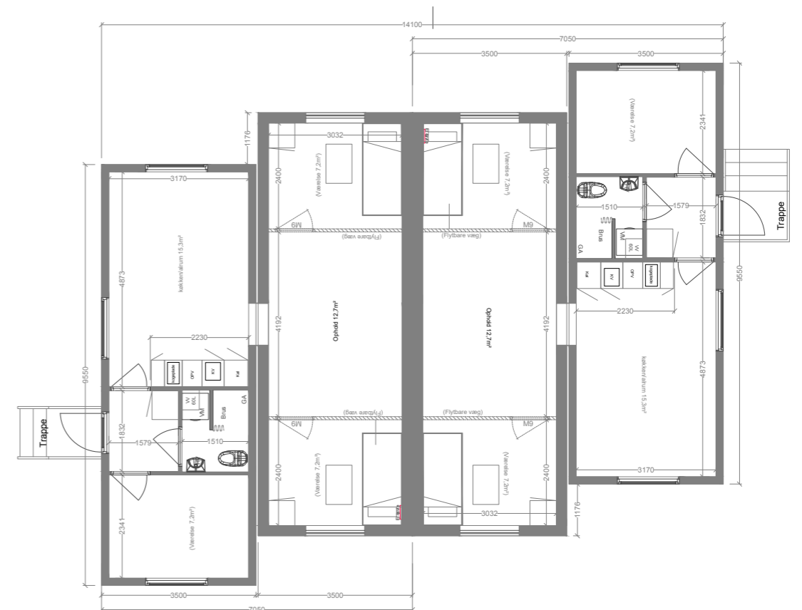
PAVILLON TYPE 2